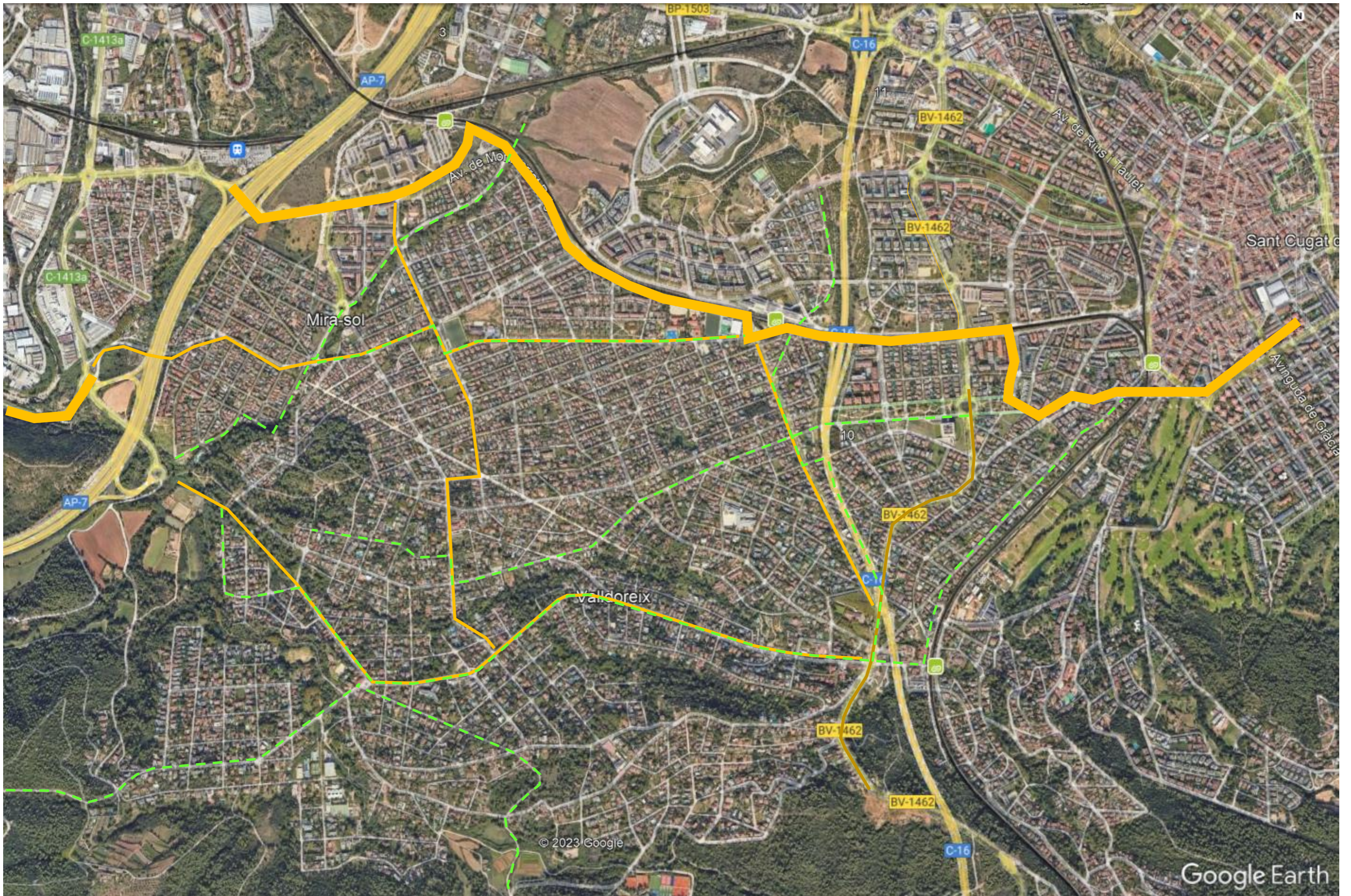
Àmbit territorial de l'EMD de Vall d'oreix i entorn.

Vies estructurants: proposta del PDUM. PDUM: plànol derivat del O04D